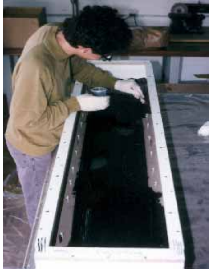
Bild 4: Nach dem Wachsen geht es wie üblich los: Das Epoxyd-Formenharz wird blasenfrei aufgestrichen. Hier ist darauf zu achten, daß alle Metallteile voll- ständig mit Formenharz bedeckt sind. Da die Laminierkeramik mit Wasser angerührt wird, würden sie sonst beim Aushärten rosten. Und rostige Passdübel lösen sich schlecht!

sen, damit eine ebene Abstellfläche auf der Rahmen- kante entsteht. Das erleichtert später den Umgang mit der Form und hilft Verzüge zu vermeiden. (Resopal oder andere beschichtete Spanplatten eig- nen sich ebenfalls.)