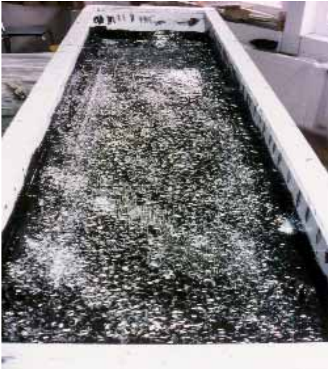
Bild 5: Um eine optimale Verbindung vom Formenharz mit der Kupplungsschicht zu erreichen, haben wir Glaschnitzel auf das Formenharz gestreut. Bei dünnen Formenharzschichten kann es allerdings geschehen, daß diese sich beim Tempern leicht abzeichnen. In solchen Fällen empfehlen wir Baumwollflocken für diese Aufgabe.

Nun wird ganz klassisch eine Kupplungsschicht aufgetragen. Zuerst EP-Harz + Baumwollflocken, danach Harz + Glasschnitzel. Wichtig ist, alle Ecken und Kanten gut auszurunden, sowie um sämtliche Muffen und Stifte gut aufzufüttern.