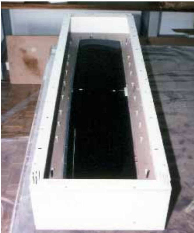
Bild 3: Hier ist bereits alles für die Abformung montiert in- klusive Passdübel, Leisten für den Absaugkanal etc. Der Rahmen für den Formenrand besteht aus Reso- palplatten und wurde direkt an das Urnegativ ange- schraubt. Der obere Rand ist L-förmig abgeschlos-

sen, damit eine ebene Abstellfläche auf der Rahmen- kante entsteht. Das erleichtert später den Umgang mit der Form und hilft Verzüge zu vermeiden. (Resopal oder andere beschichtete Spanplatten eig- nen sich ebenfalls.)